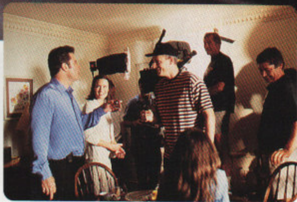
John Travolta et Nick Cassavetes s'apostrophent. Au fond, Robin Wright compte les points.

Pour "Décroche les étoiles", Nick dirigeait Gena Rowlands, sa maman. Pour " She's De Lovely ", d'après un scénario inédit de papa John, il décroche trois nouvelles stars: Sean Penn, Robin Wright et John Travolta.