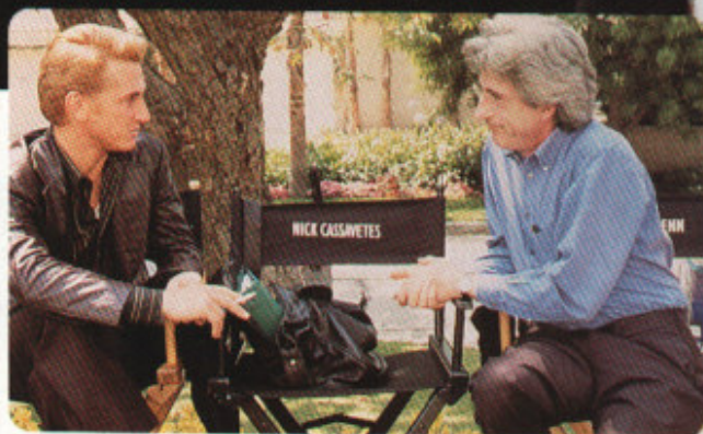
Sean Penn (qui rêvait de réaliser le film) et René Cleitman (qui produit son 2 e film américain après Décroche les étoiles ).